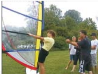
Theorie an Land

In den Sommermonaten steht Kindersurfen bei uns im Mittelpunkt. Kinderriggs von 2,5-3,5m und entsprechende Boards liegen für die Minisurfer bereit. Die Kids werden mit den Erwachsenen unterrichtet, immer ganz dicht am Surflehrer. Mit kindgerechten Methoden kommen die „surfenden Meter“ schnell voran und haben viel Spaß am Wassersport. Sogar ein international anerkannter Kindersurfschein kann erworben werden.